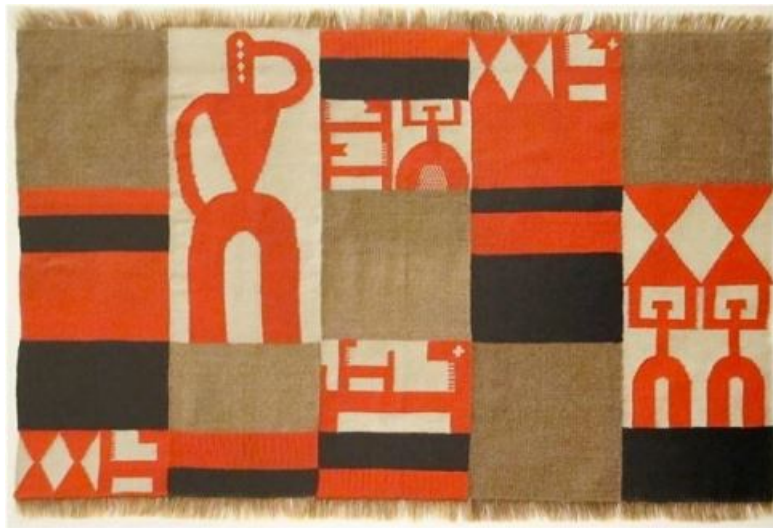
Composición vertical-horizontal (1918) de Sophie Taeuber-Arp © Taeuber-Arp, 1918

Un año más tarde, en marzo de 1917 se inauguraría la Galería Dadá y el movimiento que pretendía destruir todas las convenciones con respecto al arte encontraría más adeptos en Alemania (artistas e intelectuales del movimiento espartaquista) y en Francia (André Breton, Louis Aragon y el poeta italiano Giuseppe Ungaretti). Para la ceremonia de apertura de la galería, Sophie Taeuber bailó una pieza con versos de Ball y portando una máscara chamánica diseñada por Janko. La danza, junto con el bordado, fueron quizás los puntos de partida decisivos de su creación artística.