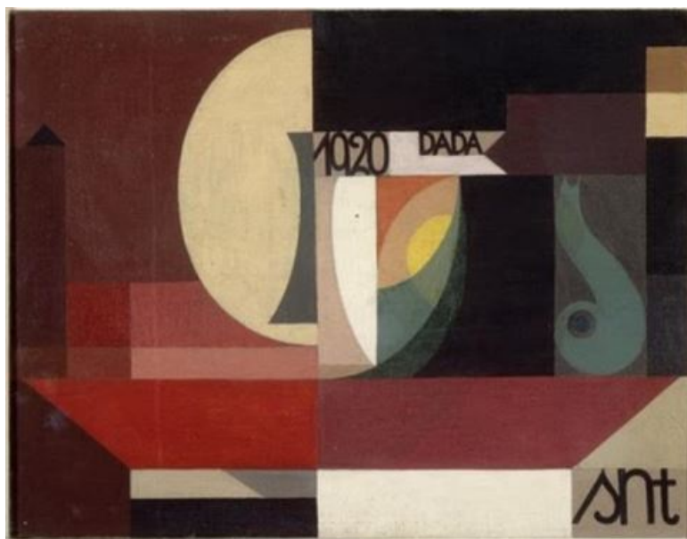
Dada-Komposition (1920) de Sophie Taeuber-Arp. © Taeuber-Arp, 1920

A partir de mayo de 1916 y hasta 1929 Taeuber-Arp dirigió la clase de diseño textil de la Escuela de Artes Aplicadas de Zúrich. Durante la Primera Guerra Mundial (Suiza fue neutral) Sophie ingresó en 1915 a la Unión Suiza de Artistas, Profesores de Arte y Diseñadores ( Schweizerische Werkbund que cumplió su primer centenario de vida en 2014) a la que perteneció hasta 1932. En una exposición en la Galería Tanner de Zúrich conoció a Hans Arp. Ambos rechazaban las formas artísticas tradicionales y buscaban formas y materiales alternativos.