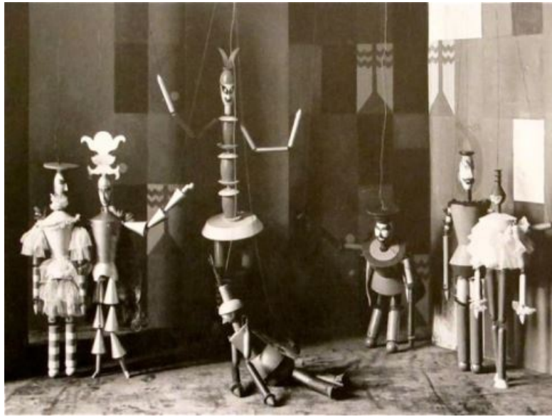
Escenas de la obra para marionetas 'Rey ciervo' realizadas por Sophie Taeuber-Arp en 1918 © Taeuber-Arp, 1918