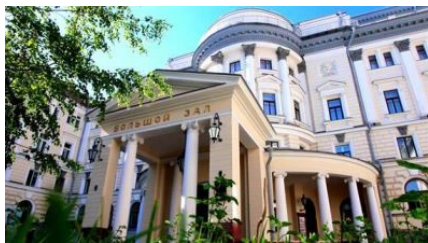
Actual entrada a la sala Bolshoi

Tolstoi 18 , Consejero del Presidente de la Federación Rusa, el Ministro de Cultura, Sr. Vladimir Medinski, representantes del Patriarca Ruso y del Ayuntamiento de Moscú, pronunció un discurso ante de la asamblea festiva donde hizo un amplio resumen de los mayores logros de la institución a lo largo de su historia. A continuación, los cinco profesores veteranos más destacados del Conservatorio, fueron condecorados con Medallas de Oro 19 .