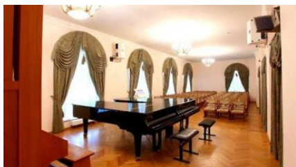
La sala Miaskovskogo

Guédike y el de Valeri Kiktá), el de clave, el de Música de cámara y cuartetos de cuerda de Nikolái Rubinstein, el de dúos “Piano voce”, el de directores de coro y 2 concursos de composición musical (el del compositor Miaskovski y el de Peter Urgenson 14 ).