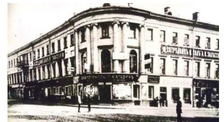
Primer edificio del Conservatorio alquilado en la calle Vozdvizhenka en los años 1866-1871

Paralelamente, con la apertura de las asambleas musicales de la Sociedad moscovita, Nikolái Rubinstein 4 organiza e inaugura el 12 de octubre 1860 las Clases Musicales de nivel elemental. Para evitar gastos excesivos, decide alojar la escuela en su propio apartamento en la calle Sadóvaya [de Jardines] y después, en 1864, en una casa alquilada en la calle Mojovaya. Para el curso 1865/1866 la cantidad de alumnos asciende de 25 a 258. Finalmente, el 24 de diciembre 1865, se publica la resolución de la fundación del Conservatorio de Moscú.