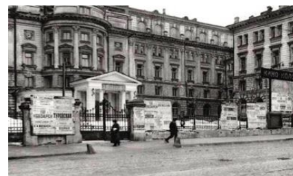
Edificio del Conservatorio de Moscú en los años 1920s

El precepto ejemplar de Nikolái Rubinstein sobre “la importancia de los artistas rusos” y “el altísimo nivel de preparación” tanto del profesorado como del alumnado ha sido cumplido irreprochablemente 13 . Cada año, alrededor de 150 estudiantes han sido galardonados en concursos internacionales de prestigio y, entre los 230 estudiantes que terminan el centro docente, el 60 % se gradúan con el “Diploma Rojo” [con mención honorífica de excelencia]. En 2015 el alumnado ascendió a 1150 alumnos. Entre los 222 músicos jóvenes que han sido admitidos después de la última prueba, 30 son extranjeros. Según el Decanato del alumnado extranjero, actualmente en el Conservatorio de Moscú estudian en total 215 alumnos de los 27 países de Europa, Asia, Australia, America Central y del Norte.