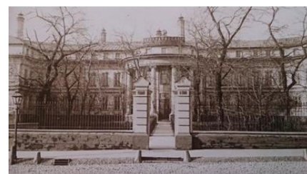
Palacete del conde Vorontsov donde se halló el Conservatorio de Moscú en 1894 antes de la reconstrucción

A finales de 1893 la Dirección de la Sociedad Musical decide la construcción de un edificio nuevo para el Conservatorio, reconstruyendo el antiguo palacete. El proyecto de construcción, iniciada en 1895, fue presentado por V. Zagorsky, afamado arquitecto. A pesar de la complejidad del proyecto, el Conservatorio pudo reanudar sus clases para el curso 1898/1899 en el bloque izquierdo del edificio, incluyendo el auditorio de la Sala Mali [Menor], con un aforo de 435 personas. Sin embargo, la apertura de la famosa Sala Bolshoi (1740 de aforo) no se celebró hasta la tarde del 7 de abril de 1901.