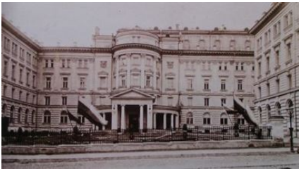
El Conservatorio de Moscú en los días de la Revolución de febrero 1917