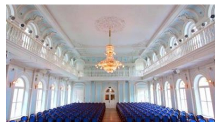
La sala Rajmaninovski en la actualidad