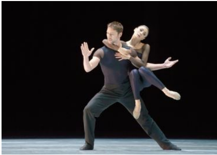
Jirí Kylián: Wing of Wax © 2017 by Bettina Stoess

Ninguna de las obras de Kylián se parecen entre si y estas cinco no son ninguna excepción. En 27' 52" , el tiempo que dura exactamente su interpretación: 27 minutos y 52 segundos, el coreógrafo checo nos sumerge en el mundo