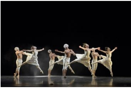
Jirí Kylián: Deutsche Tänze © 2017 by