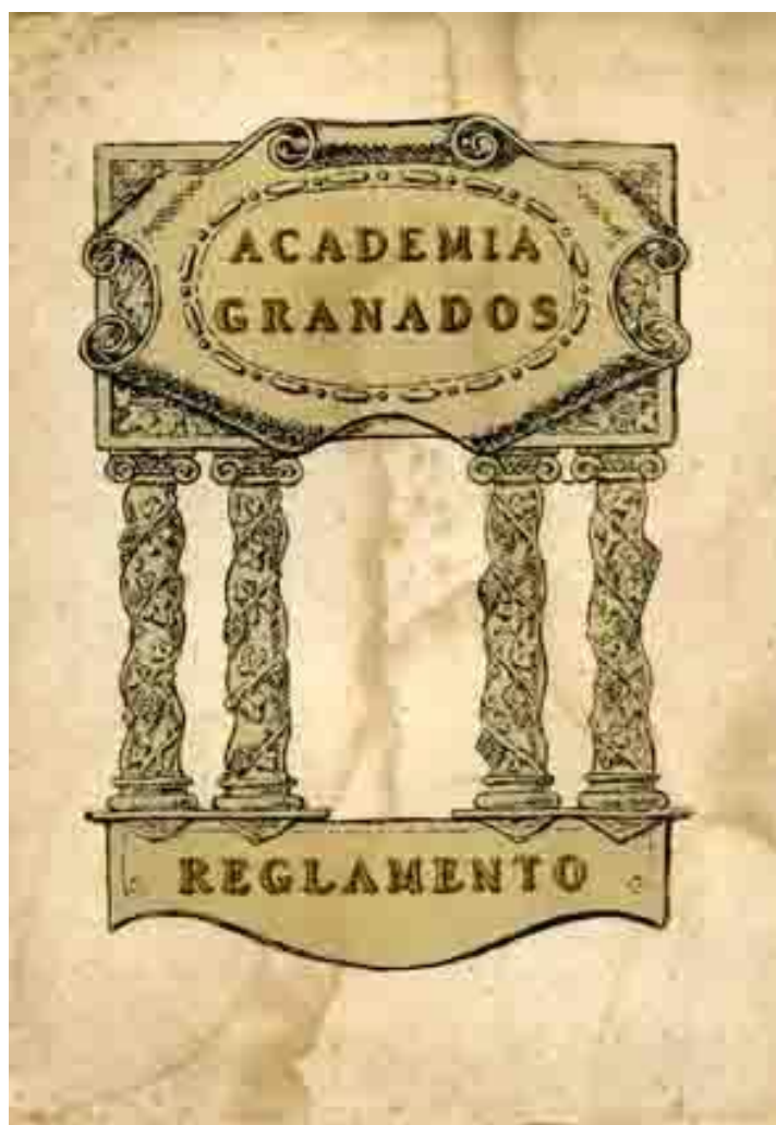
Academia Granados. Reglamento.

Por su parte, Francisco Gal aparece como propietario de la vivienda de la calle Cortes, 347, entresuelo, en la cual ejerció como abogado su hijo Enrique. Éste, a su vez, aparece en algún momento como propietario de la vivienda de Tallers, 68, que antes perteneciera a su padre. En esa vivienda instaló Enrique Granados su Academia el año 1900, antes de su inauguración pública, que se produciría el año 1901 ya en la calle Fontanella.