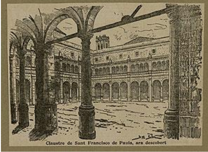
Claustro de San Francisco de Paula.