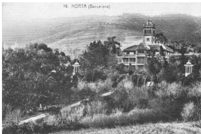
Sant Joan d’Horta a finales del siglo XIX.