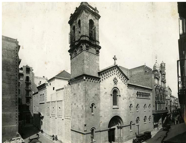
San Francisco de Paula a principios del siglo XX.