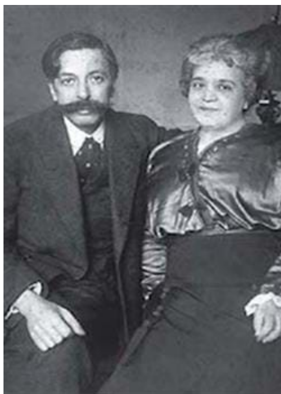
Enrique Granados y Amparo Gal ca. 1916