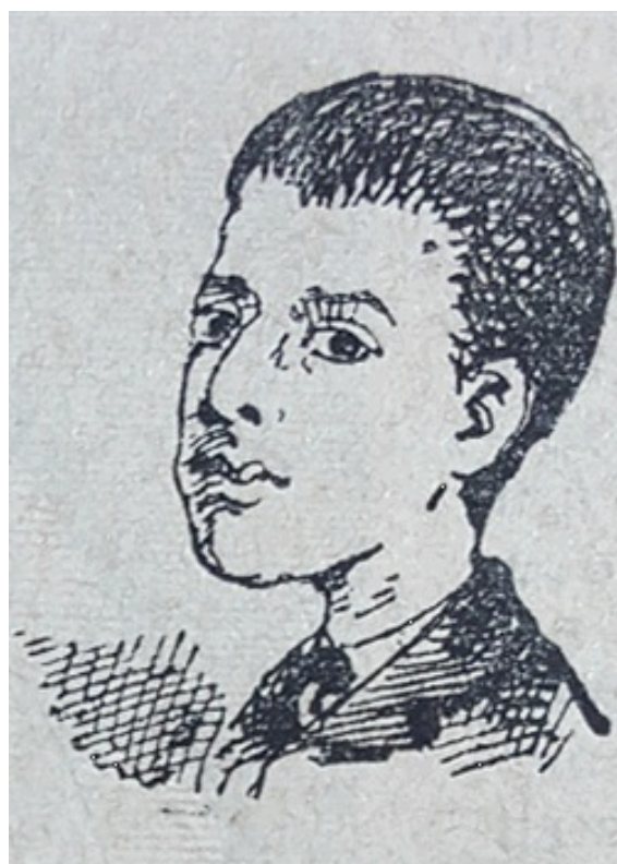
Enrique Granados adolescente