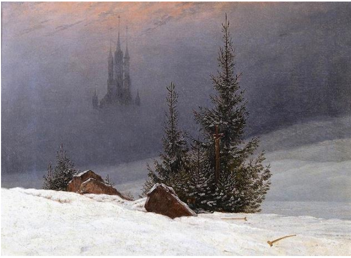
Casper David Friedrich. Winterlandschaft (1811). Museum für Kunst und Kulturgeschichte.