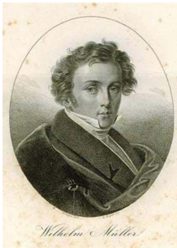
Wilhelm Müller