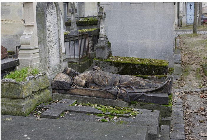
Tumba de Ambrogio Volpini en el cementerio Père-Lachaise de París..

Sea como fuere, cuentan las crónicas que Elisa mostró desde su infancia aptitudes especiales para la música, recibiendo de su padre la formación musical inicial, que más tarde completó formando ya parte como miembro del coro del Teatro San Fernando de Sevilla y como tiple comprimaria en diversas compañías líricas. La primera aparición en hemerotecas podría ser la compañía de ópera española que debía actuar en el teatro en septiembre de 1853, bajo la dirección del maestro José Valero * .