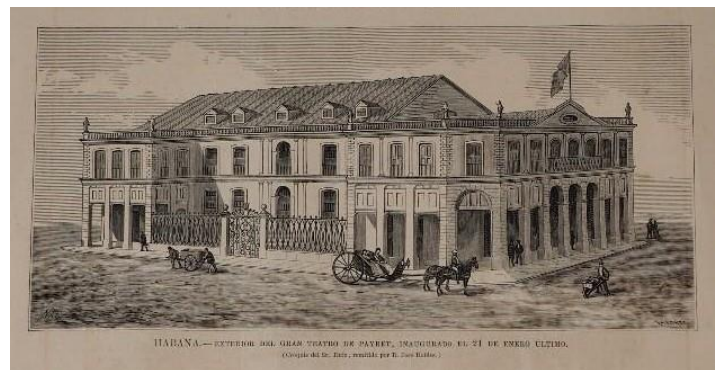
Gran Teatro de Payret en 1877.