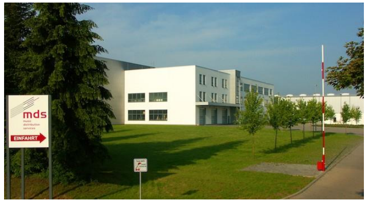
Centro logístico de Schott Music en 2015. © by Schott Music GmbH & Co. KG.

© 2020 Juan Carlos Tellechea / Mundoclasico.com. Todos los derechos reservados