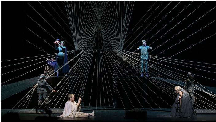
Der Kaiser von Atlantis , producción de Ilaria Lanzino.

En la maquinaria de la industrialización de la muerte del emperador Overall de la Atlántida, el arlequín y la muerte ( la vida que no puede reír más y el morir que no puede llorar más ) son espectadores pasivos en un mundo que ha desaprendido a alegrarse en vida y a morir en la muerte .