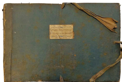
Cartapacio del Requiem de Mozart en Pamplona.

El Requiem fue la última composición de Mozart, que dejó inconclusa por su prematura muerte. De acuerdo con los autores del libro, desde fechas tempranas se convirtió en una especie de música oficial para las honras fúnebres de reyes, aristócratas, militares y otros miembros distinguidos