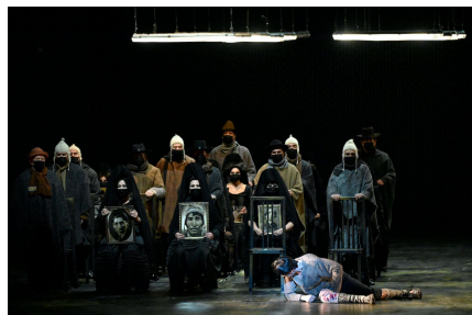
Alzira , régie de Jean Pierre Gamarra.

Quizá por ese condicionamiento, instigado por el propio compositor y por la escasa envidia de la obra, me sentí durante la representación mucho más interesado que con otros títulos verdianos que, imprescindibles para completar el reto del bilbainísimo Tutto Verdi , son perfectamente prescindibles fuera de ese marco: varios títulos de los estrenados antes de 1851.