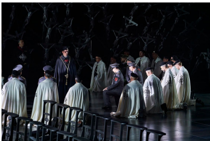
'Norma' de Bellini. Puesta en escena: Àlex Ollé. Dirección musical: Domingo Hindoyan. Barcelona, Gran Teatre del

Yoncheva fue exactamente lo contrario: fiato administrado ad libitum , agudos buenos cuando no fueron gritados, poca media voz, destacó en las agilidades, y un registro grave forzado y feo, un timbre poco claro (como sucedía hasta hace nada con las más callistas -o calassianas- que Callas), al que se adjuntaron tintes veristas reñidos con el estilo como un 'indegno' al final del primer acto que sonaba más en sintonía con La fanciulla del West , para terminar en un ataque de llanto convulsivo que ni la más verista de las Toscas. Las risitas irónicas antes de 'In mia man alfin tu sei' remitían en cambio a los principios del cine sonoro.