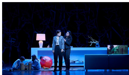
'Norma' de Bellini. Puesta en escena: Àlex Ollé. Dirección musical: Domingo Hindoyan. Barcelona, Gran Teatre del Liceu, julio de 2022.

Así casi toda la ópera, menos el inicio del segundo acto