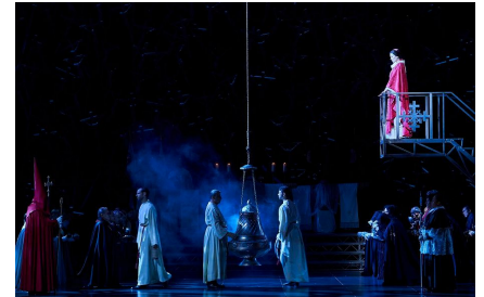
'Norma' de Bellini. Puesta en escena: Àlex Ollé. Dirección musical: Domingo Hindoyan. Barcelona, Gran Teatre del Liceu, julio de 2022.

Massi (debut en el Liceu luego de un intento frustrado de hace algunos años) parece tener la voz necesaria para Pollione, pero la emisión no es del todo seguro y el agudo cambia de color y volumen y no corre siempre libre. De bello timbre, el de Hernández es tal vez demasiado lírico y la parte lo obliga a forzar innecesariamente: su mejor momento fue el segundo acto. Digamos que en sus variaciones de la cabaletta (como en el caso de Yoncheva) hubo momentos al final donde la legítima libertad pareció descarrilar y simplemente desfigurar la música.