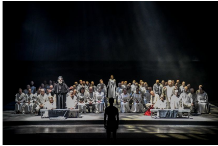
Leoš Janáček: Desde la casa de los muertos. Dirección musical: Jakub Hruša. Producción de Jiří Heřman. Festival Janáček Brno 2022.

que se refiere a la propia escena como más allá de ella, un interés que aquí se concreta básicamente en acciones en los laterales o enfrente, justo delante del público. Dos juegos de timbales a cada lado con sus respectivos intérpretes-guardias vestidos de rojo, la banda del segundo acto de Desde la casa de los muertos también desde el lateral derecho, tránsito continuo de personajes por delante del público en la primera fila para resaltar sus roles y acciones, etc. Todo ello acentuado por el interesante