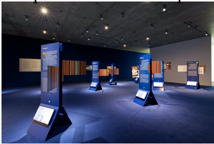
Die letzten Europäer. Jüdische Perspektiven auf die Krisen einer Idee.

La exposición también presenta a personalidades influyentes como la luchadora de la Resistencia y Presidenta del Parlamento Europeo Louise Weiss , el inventor del esperanto Ludwik Zamenhof , el pionero de las agencias de noticias Paul Julius Reuter y el superviviente de la Shoah (Holocausto) y "cazador de nazis" Simon Wiesenthal . Uno se queda estupefacto al leer de que fue objeto de amenazas antisemitas