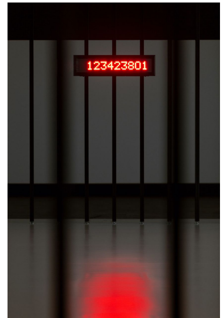
Die letzten Europäer. Jüdische Perspektiven auf die Krisen einer Idee. © 2022 by Eva Jünger.

Y tampoco se menciona el hecho de que la tropa terrorista de la organización Cónsul, surgida del Reichswehr Negro y dedicado a "combatir todo lo antinacional e internacional, el judaísmo y la socialdemocracia", operaba en toda la República de Weimar desde la