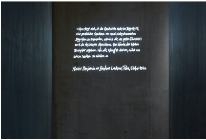
Die letzten Europäer. Fragmento de una carta de Walter Benjamin a Stephan Lackner, París, 5 de mayo de 1940. © 2022 by Eva Jünger.