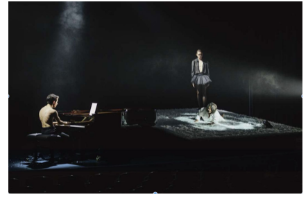
«La voix humaine», régie de Rafael Villalobos.

Y en esta producción de Rafael Villalobos están ausentes la coherencia y la magia. Por eso no convence. No existe correlación aparente entre lo que canta Ella y la acción escénica. Manca finezza en la dirección actoral, que por momentos roza lo ridículo, como cuando pide a la soprano que trepe esforzadamente por la rampa inclinada, calzada con unos incómodos zapatos de tacón, que se quita al llegar a lo alto de la rampa para permanecer descalza todo el resto de la representación. ¿Tiene sentido esta ocurrencia?: Lo tiene, es burdo pero lo tiene. Durante la representación, en algunos breves momentos, la soprano se agacha, recoge un zapato del suelo y se lo pega a la cara simulando que habla por teléfono.