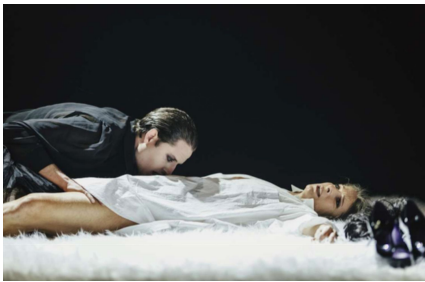
«La voix humaine», régie de Rafael Villalobos.

No es la única ocurrencia, pero sin duda es la más burda y significativa, junto a aquellos momentos en que 'El insostenible miedo a morir solos', o sea, el actor, la masturba, sin ningún sentido dramático y de un modo que manifiesta un deseo de escandalizar gratuitamente al público, característico de las producciones comunistas y sobre todo de las germánicas en los años posteriores a la caída del Muro de Berlín. Un fruto del puritanismo y la represión moral del estalinismo que, al igual que sucedió con la moda del destape en la Transición Española, sirven de pretexto para parecer modernos y omitir cualquier alusión a cuestiones molestas