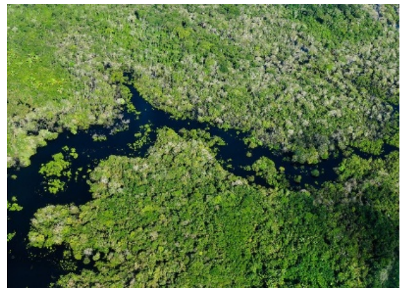
Selva amazónica cerca de Manaus

La selva amazónica y la meseta tibetana están en lados distintos de nuestro planeta y, sin embargo, los cambios en el ecosistema sudamericano pueden desencadenar cambios cerca del Himalaya, según un nuevo estudio publicado en la revista científica Nature y en el que participan investigadores del Instituto de Potsdam para la Investigación del Impacto Climático ( PIK ).