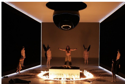
'Salome' de R. Strauss. Dirección musical: Michael Güttler. Dirección escénica: Damiano Michieletto. Milán, Teatro alla Scala, enero de 2023.

Más relevantes para sus partes (en lo vocal e histriónico) me parecieron los reinantes, Ablinger-Sperrhackle es un excelente característico y se lució mucho en todos los aspectos de su Herodes (notabilísima la frase que cierra la ópera), pero Watson casi lo eclipsa con una Herodías bien cantada y mejor actuada.