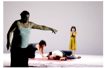
'Salome' de R. Strauss. Dirección musical: Michael Güttler. Dirección escénica: Damiano Michieletto. Milán, Teatro alla Scala, enero de 2023.

Volle es una voz ideal para el Bautista y casi desplaza la atención de la protagonista en su larga intervención inicial y en el volumen que se oía cuando cantaba entre bambalinas (o desde la cisterna). Pero alguien habría debido vestirlo de modo más acorde con su físico; de lo contrario, la descripción que hace Salomé del mismo podría parecer obra del alcohol o alguna droga fuerte.