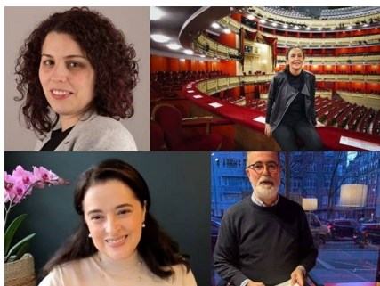
Mujeres en la música. tercer encuentro.

Es una evolución dispar, sometida a catalizadores u obstáculos generales y específicos. Cuanto más se ha avanzado en la incorporación de las mujeres a las diversas esferas de la realidad de la vida musical más ha sido patente lo minucioso de la dificultad específica de cada ámbito. Uno de los desafíos radica, por ello, en relacionar el proceso general de la incorporación a la igualdad efectiva de las mujeres ante los ámbitos que norman las leyes, que por su propia naturaleza tienden a la universalidad como garantía de la no discriminación, al proceso específico de su incorporación en este o aquel ámbito de la vida colectiva.