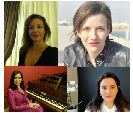
Mujeres en la música. Segundo encuentro.

Es en este terreno de lo concreto donde se mide con mayor eficacia la tensión entre lo ideal y lo real, donde se puede encontrar las vías concretas para superarlas. En líneas generales, hay un cierto recorrido común del proceso de integración efectiva de las mujeres a la totalidad de esferas de lo musical y de la mujer en el promedio de otros sectores o ámbitos de la vida. Pero, como se dice, dios y el diablo están en realidad en la letra pequeña, en lo específico. Así, las velocidades y alcances del proceso efectivo de materialización de la igualdad de oportunidades son diversos: más lento o superficial en unos casos (estereotípicamente, las mujeres directoras de orquesta, por ejemplo) que en otros (las cantantes de ópera). Pero importa mirar con detenimiento cada caso, pues establecer patrones muy generales de análisis o evaluación llega a menudo a simplificar lo específico o singular, trivializándolo u ocultándolo.