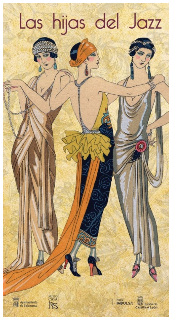
Las hijas del Jazz

Con estos antecedentes y lo que había leído previamente en la presentación de la exposición, fui con muchas ganas a esta exposición que se centraba en "la transformación del papel de la mujer en la sociedad de los años 20, cuando surgen las denominadas flappers ". Por citar partes del folleto: