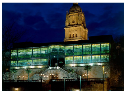
Fachada sur de la Casa Lis en Salamanca.

El Museo Art Nouveau y Art Déco – Casa Lis de Salamanca narra a través de la exposición “Las hijas del Jazz” el papel de la mujer durante la Primera Guerra Mundial y la situación que ocupó después de la contienda. El conflicto bélico supuso una oportunidad para la emancipación de muchas mujeres, que vieron en su incorporación al mundo laboral, la ocasión de liberarse del rol tradicional que la sociedad decimonónica les había asignado. No ocurrió de forma general en todas las capas sociales ni en todos los países. Así, Francia y Estados Unidos con una sociedad liberal facilitaron esta emancipación. Al contrario, Alemania e Inglaterra, con una sociedad más conservadora dificultaron este