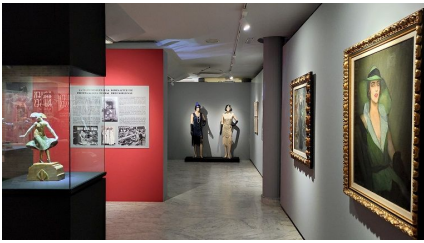
Vista de la exposición 'Las hijas del Jazz' en el Museo Casa Lis de Salamanca.

ya sabe, es probable que quede decepcionado. Incluso si se hubiera tratado de una reorganización de fondos, como hacen a veces los museos para conmemorar algo concreto, pero sin presentarlo como una exposición independiente, me hubiera decepcionado. Así me he quedado con la sensación de que no gasté bien mi dinero (y no es que me importe, porque el precio de la entrada va para mantener un museo que me gusta) y de que los estudios de género, o cuando menos el intento de dotar de una perspectiva femenina a hechos ya bien conocidos, es todavía una tarea pendiente.