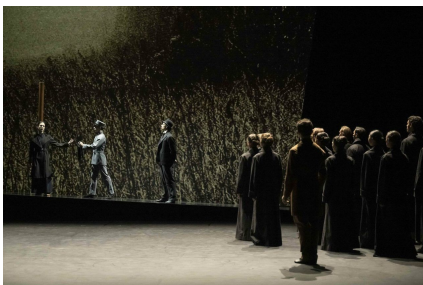
Mata Hari de Robert North.