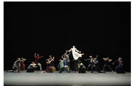
Mata Hari de Robert North.

vida libre y autodeterminada; rechazaba las convenciones sociales; buscaba la aventura; le encantaba el lujo. Cuando su arte danzístico deja de tener demanda, busca otras fuentes de ingresos. Con la Primera Guerra Mundial como telón de fondo, se ve envuelta en las intrigas políticas de las grandes potencias. Trabaja como espía para el servicio secreto del Imperio Alemán, entre otros, subestima el peligro y pierde el control.