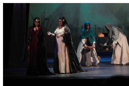
Aida, régie de Daniele Piscopo

Precisamente Radamés fue una de sus grandes creaciones como lo fueron Calaf, Manrico,