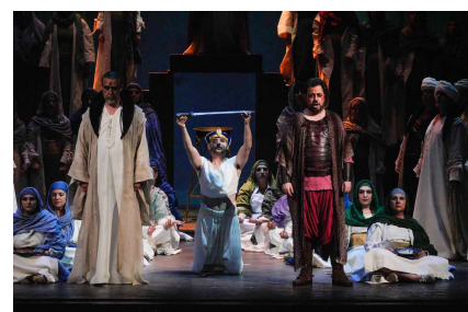
«Aida», régie de Daniele Piscopo.

No dedicaremos mucho espacio a la propuesta escénica de Daniele Piscopo, todo un desconcertante “quiero y no puedo” de elementos anacrónicos, ausencia absoluta de dirección de actores, errática iluminación y un desagradable aire kitsch, como a obra de fin de curso, en vestuario y escenografía.