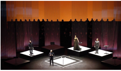
'Anna Bolena' de Donizetti. Gabriel Caputo, concepto visual. Iñaki Encina Oyón, dirección musical. Buenos Aires, Teatro Colón, junio de 2023.

por la acertada gama de colores y su variedad, y por dar excelente marco plástico a toda la obra.