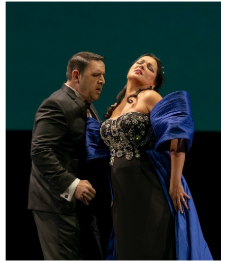
Caputo, Il Trovatore

Giacomo Sagripanti aportó una versión respetuosa y puntillosa de la partitura. Es evidente el acabado conocimiento de la obra del director italiano, quien logró una versión con pleno estilo verdiano, vibrante pero a la vez sin caer en trazos gruesos o sonoridades desbordantes, con tiempos adecuados y cuidado balance entre el foso y la escena. La Orquesta Estable respondió de manera precisa y con gran prestación.