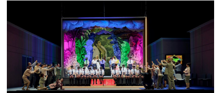
«Otello», régie de Paul-Georg Dittrich.

Personalmente para mi la libertad de poder expresar tus emociones es algo primordial en todo ser humano, obviamente respeto mas al crítico con conocimientos que escribe mostrando su nombre y cara que a aquellos que abuchean desde la oscuridad de un teatro. Pero sea cual sea el caso, Dios bendiga el libre albedrío, la democracia y la libertad de expresión.