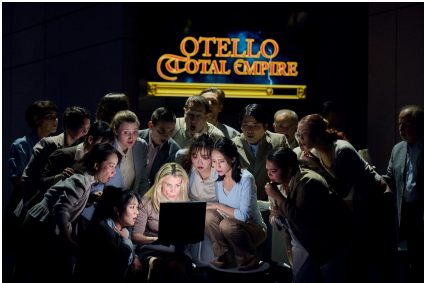
«Otello», régie de Paul-Georg Dittrich.

Todo comienza de forma bastante inofensiva en una iluminada oficina (escenografía y vestuario Anika Marquardt , Anna Rudolph ). Archivar expedientes, sellar documentos, hacer y recibir algunas llamadas telefónicas, un poco de charla entre los empleados de la empresa; en fin, la tediosa vida burocrática cotidiana.